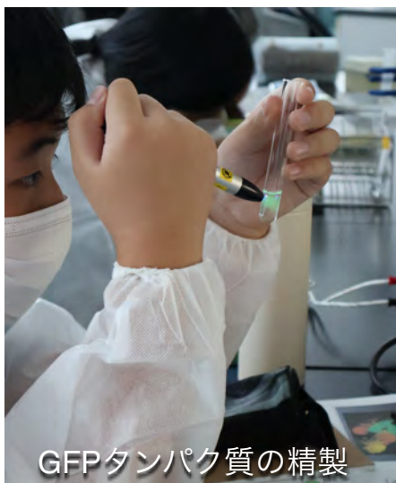
GFPタンパク質の精製