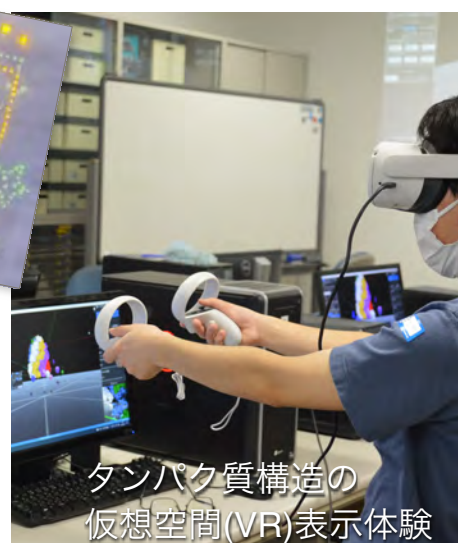
タンパク質構造の 仮想空間(VR)表示体験