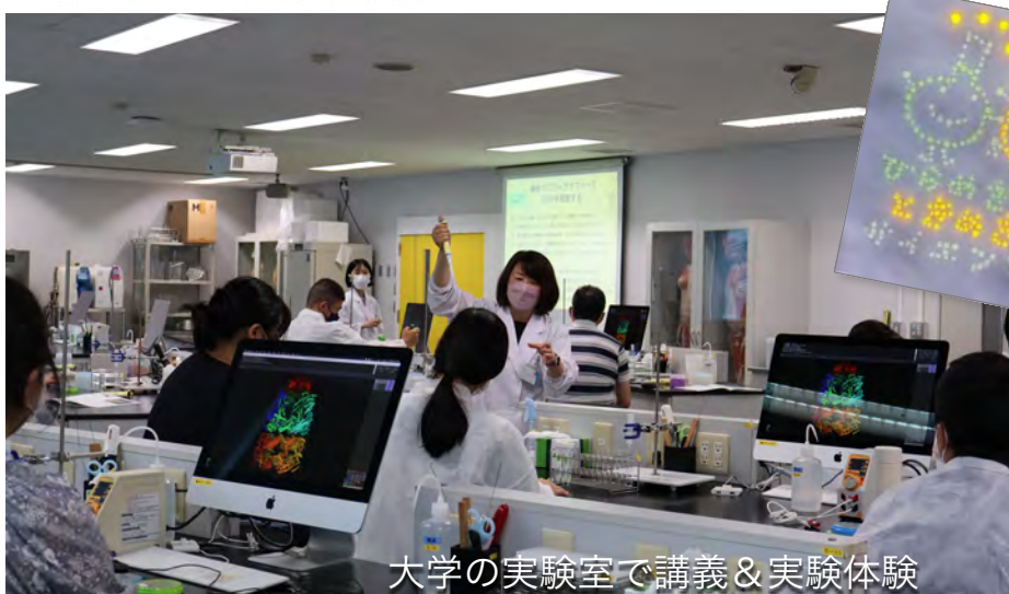
大学の実験室で講義&実験体験